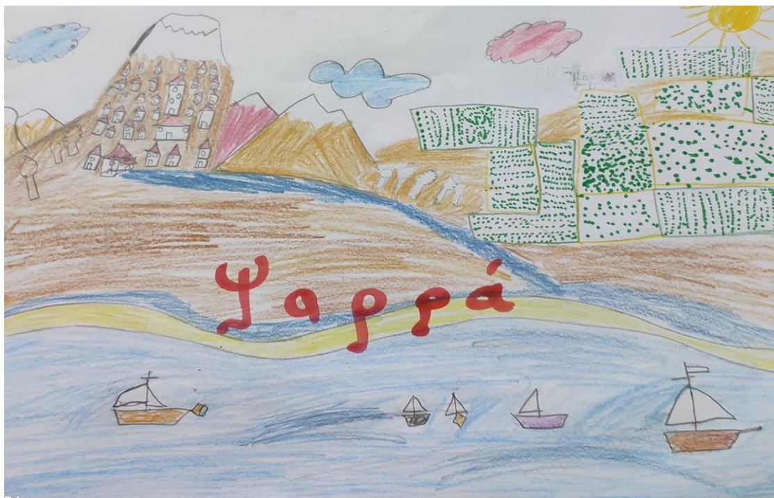
Έργο του Φερεντίνου Κων/νου