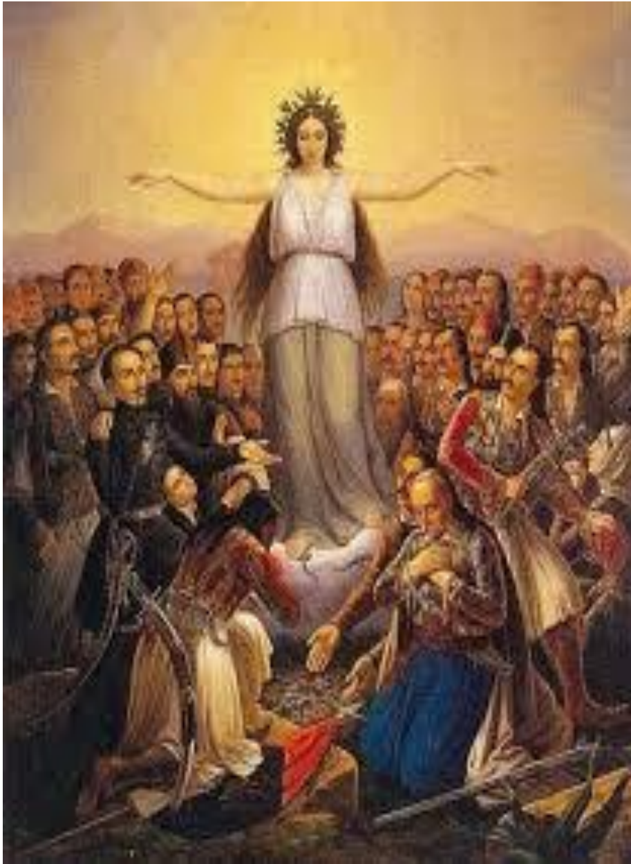
«Η Ελλάς ευγνωμονούσα» Θεόδωρος Βρυζάκης 1858