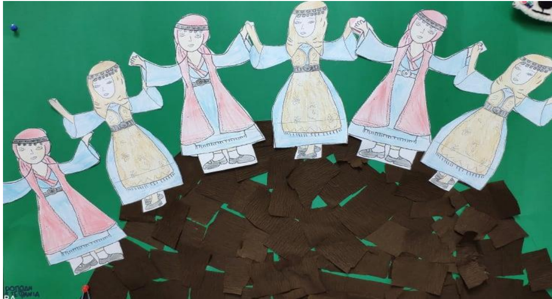
Έργο της Ροπόδη Στεφανίας « ο χορός του Ζαλόγγου »