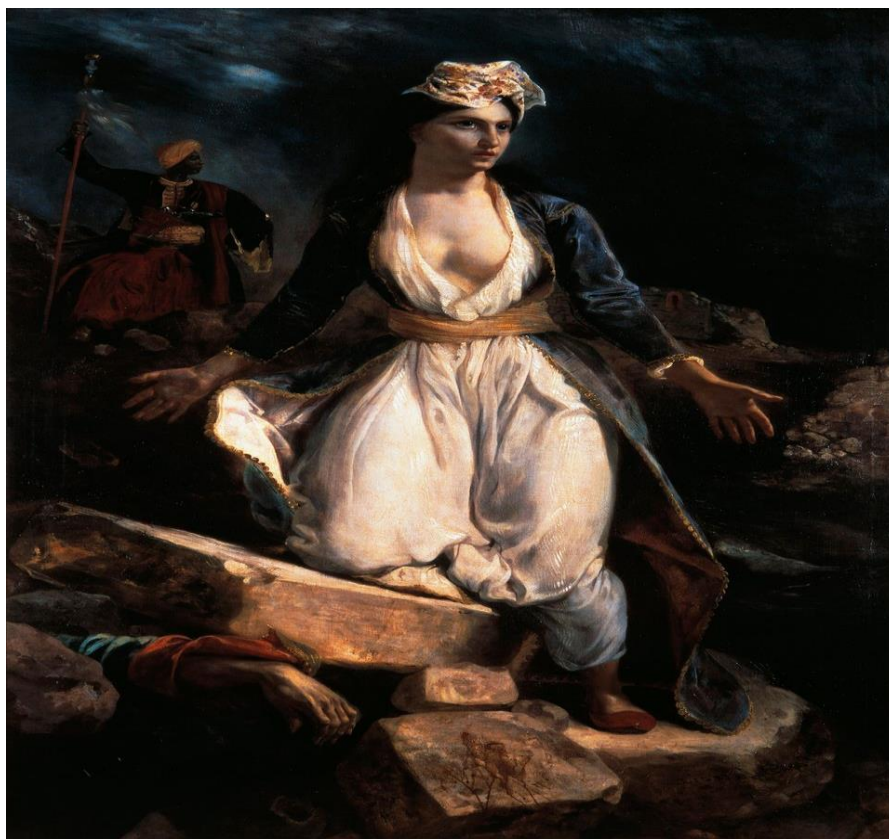
«Η Ελλάδα στα ερείπια του Μεσολογγίου» Ευγ.Ντελακρουά

Παρατηρήσαμε και περιγράψαμε τους πίνακες του Ευγένιου Ντελακρουά και του Θωδωρή Βρυζάκη